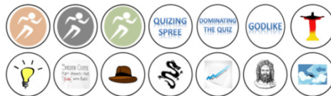
Abbildung 2: Darstellung aller erreichbaren Abzeichen

Für die Umsetzung des Feedback Elementes wird ein „richtig-falsch“ Feedback gewählt. Die vom Probanden gewählte Antwort färbt sich direkt nach Beantwortung einer Frage grün oder rot. Zusätzlich wird bei einer falschen Antwort die richtige Lösung grün markiert. Die Abzeichen sind identisch zur Ursprungsstudie [12]. Abbildung 2 stellt die erreichbaren Abzeichen dar.