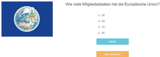
Abbildung 1: Beispielfrage aus der Experimentalgruppe Story

Die Probanden werden unter keiner der Versuchsbedingungen über den Umfang des Quiz in Kenntnis gesetzt. Die Grundidee des Quiz ist es, die Probanden so lange spielen zu lassen, wie es ihnen Spaß bringt, um anhand der Anzahl beantworteter Fragen die Wirkung der verschiedenen Spielelemente zu messen.