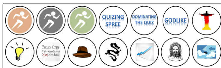
Abbildung 1: Darstellung aller erspielbaren Abzeichen

vergeben oder für mehrere korrekte Antworten in Folge. Für beide Kategorien werden jeweils drei Abstufungen verwendet, und zwar von leicht zu schwer (zum Beispiel drei, fünf oder zehn richtige Fragen hintereinander). In Abbildung 1 sind alle erspielbaren Abzeichen dargestellt. Diese werden zuerst nur grau hinterlegt. Es ist nicht ersichtlich, welche Bedingungen man erfüllen muss, um ein Abzeichen zu erhalten. Dadurch soll nur das Verhalten belohnt werden, das Quiz zu spielen und nicht, um auf ein bestimmtes Ziel hinzuarbeiten. Nachdem ein Abzeichen erspielt wurde, konnte man durch die Ansteuerung mit dem Mauszeiger erfahren, wofür das Abzeichen vergeben wird. Zusätzlich wurde man durch eine Bildschirmblendung informiert, falls man gerade ein Abzeichen erhalten hat.