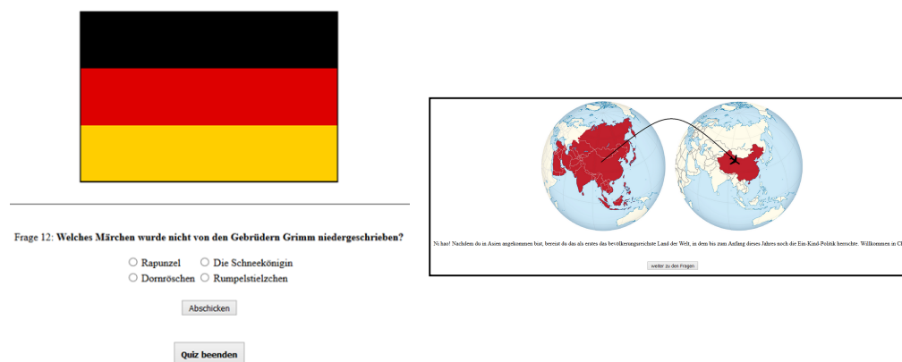
Abbildung 2: Links eine Länderfrage, hier konkret Deutschland. Rechts eine Zwischengrafik im Storymodus

Die zweite Experimentalbedingung verwendet das Spielelement Story, welches nach Kucwaj (2016) ebenfalls sehr motivationssteigernd sein soll. Als Hintergrundgeschichte wurde eine Weltreise gewählt. In dieser Experimentalbedingung wurde für jedes Land über der jeweiligen Frage ein Bild der Landesflagge angezeigt, wie in Abbildung 2 links dargestellt. Für Kontinentfragen wurde zum Beispiel ein Dschungel für Südamerika gezeigt. Außerdem gab es im Storymodus Bilder, welche den Fortschritt der Weltreise anzeigen. Abbildung 2 rechts zeigt eine solche Zwischengrafik.