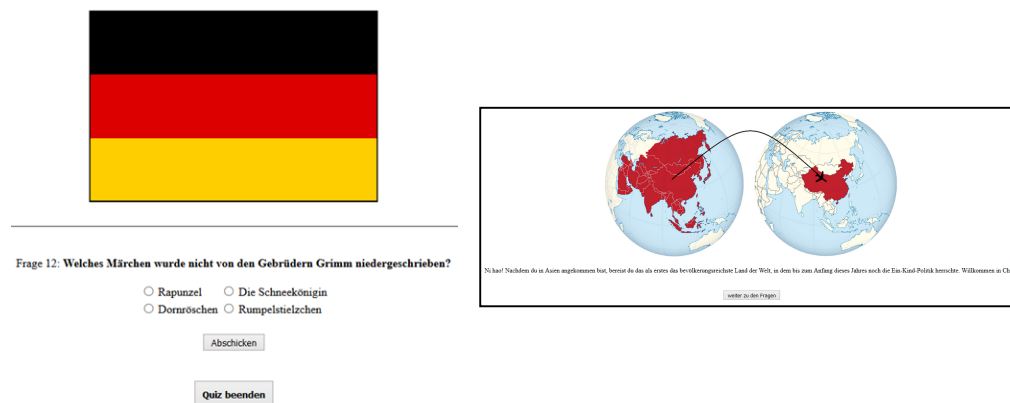
Abbildung 2: Links eine Länderfrage, hier konkret Deutschland. Rechts eine Zwischengrafik im Storymodus

Die zweite Experimentalbedingung verwendet das Spielelement Story, welches nach Kucwaj (2016) ebenfalls sehr motivationssteigernd sein soll. Als Hintergrundgeschichte wurde eine Weltreise gewählt. In dieser Experimentalbedingung wurde für jedes Land über der jeweiligen Frage ein Bild der Landesflagge angezeigt, wie in Abbildung 2 links dargestellt. Für Kontinentfragen wurde zum Beispiel ein Dschungel für Südamerika gezeigt. Außerdem gab es im Storymodus Bilder, welche den Fortschritt der Weltreise anzeigen. Abbildung 2 rechts zeigt eine solche Zwischengrafik.