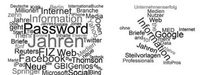
Abbildung 5: Links oben: Die Titelterme aus dem Jahre 2000 (alle Terme, die viermal (und häufiger) vorkommen); rechts oben: Die Titelterme aus dem Jahre 2005 (alle Terme, die dreimal (und häufiger) vorkommen); links unten: Die Titelterme aus dem Jahre 2010 (alle Terme, die achtmal (und häufiger) vorkommen); rechts unten: Die Titelterme aus dem Jahre 2015 (alle Terme, die zehnmal (und häufiger) vorkommen).