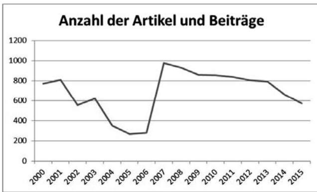
Abbildung 2: Anzahl der Artikel und Beiträge in den letzten 15 Jahren (n=10.971 Artikel).